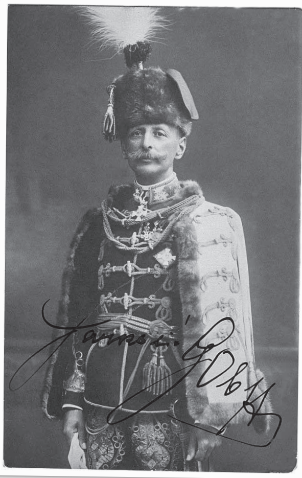
STJEPAN SARKOTIĆ (1858. - 1939.) u ugarskoj svečanoj odori

S obzirom na prijeratnu politiku nacionalnih političkih stranaka, koja je tinjala u ratnim prilikama na bosanskohercegovačkom prostoru, Sarkotić je budno pratio da se to tinjanje ne prometne u političko-remetilačke strasti. Naime, ratne prilike i političke nesnošljivosti ne idu zajedno. Hrvati su i prije i nakon aneksije prihvatili austro-ugarsku vlast. Smatrali su tu vlast zaštitnicom hrvatstva i katoličke vjere u Bosni i Hercegovini. Nadali su se i priželjkivali da će se Bosna i Hercegovina naći u državnopravnoj zajednici s Dalmacijom, Hrvatskom i Slavonijom. Muslimani nisu odricali lojalnost austrougarskoj vlasti, ali su pretežito zadržavali neku rezerviranost, mučeni žalom kad su Carigrad